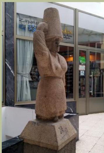
Figura de granito que representa a unha muller rural galega, levando na cabeza un balde de leite.