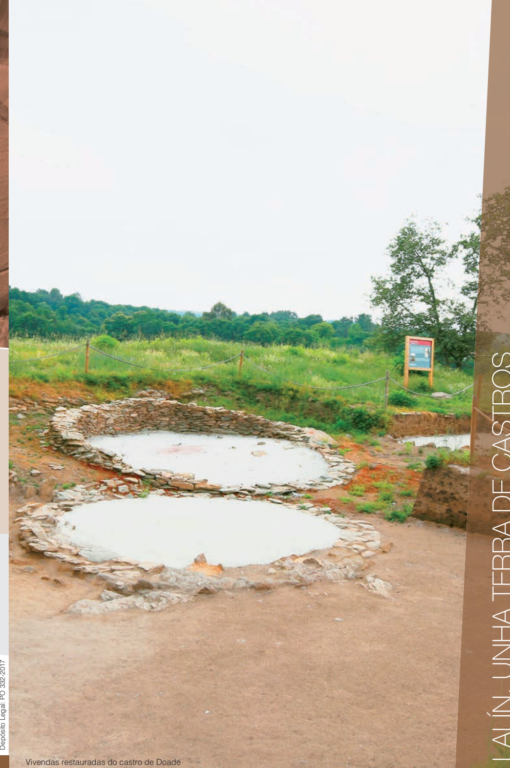
Vivendas restauradas do castro de Doade